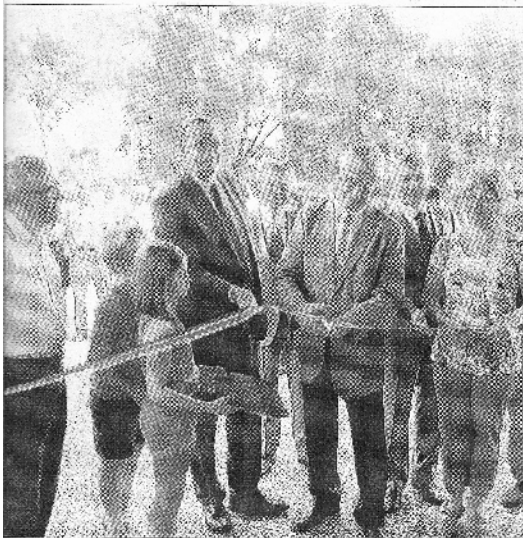
Les élus et les responsables de la gym ont procédé au traditionnel couper de ruban. sc